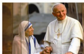
Todos los Santos Tots Sants

¡1 de noviembre! ¡Solemnidad de todos los santos!